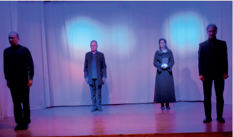
Retardus, Benedictus, Theodosius und Romanus im Felsentempel (5. Bild)

In der verborgenen Mysterienstätte der Hierophanten erscheint Benedictus mit seinen beiden Geistesgefährten Theodosius und Romanus. German fehlt, dafür tritt nun Retardus erstmals auf. Johannes erlebt die ganze Szene tief in Meditation versunken mit. Benedictus hat Johannes zur ersten Geistesschau geführt, doch soll diesem voll bewusst erlebte Wahrheit werden, was er bis jetzt nur als Seelenbild sehen durfte, so muss er Johannes weiter hinauf ins Reich des Geistes leiten. Die Zeit dafür scheint Benedictus reif, doch bedarf er der Hilfe seiner beiden Gefährten, um Johannes weiterzuführen. Theodosius soll Johannes Herz mit der Weltenkraft der Liebe erfüllen und Romanus soll ihn durch die Kraft des Weltenwillens stärken. Doch Retardus macht seinem Namen alle Ehre und widerstrebt dem ganzen Unternehmen; noch scheint ihm die Zeit nicht reif, dass ein Mensch zu neuer, voll bewusster Geistesschau erwachen soll.