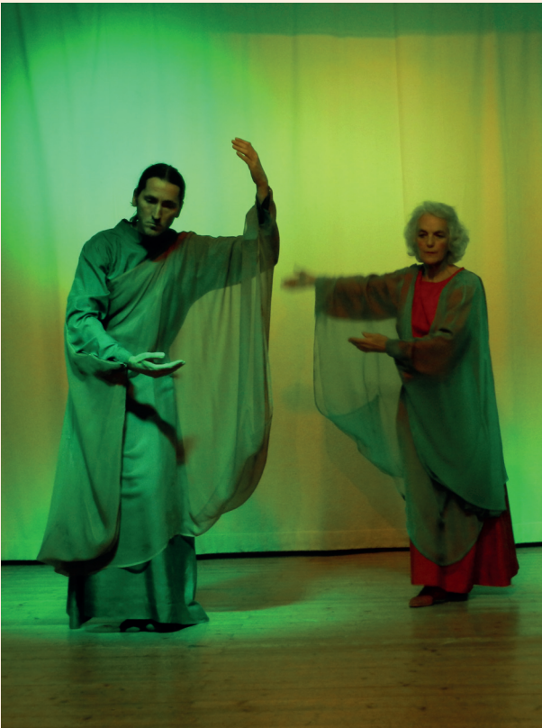
Eurythmische Darstellung des Märchens (6. Bild)

Aus Germans Mund hallt dieses Märchen jedoch ganz anders wider: Es war einmal ein Mann, der zog von Ost nach West und sah, wie die Menschen lieben und hassend sich verfolgen, doch wie Hass und Liebe die Erdenwelt regieren, war in kein Gesetz zu bringen. Da traf der Mann auf seinem Weg ein Lichteswesen, dem folgte eine finstre Schattenform. „Wer seid ihr“, frug der Mann. „Ich bin die Liebe“, sagte das Lichteswesen. „In mir erblick den Hass“, sprach