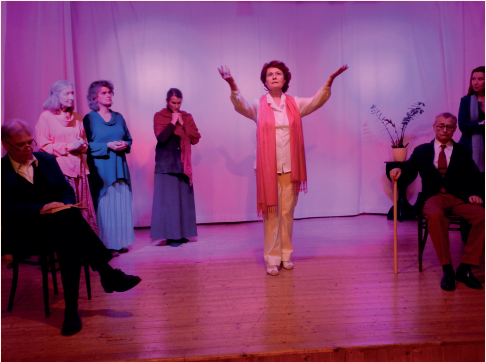
Die Vision der Theodora (1. Bild)

Einen sehr wesentlichen Bestandteil unserer Inszenierung bildet die Lichtgestaltung. Die Seele lebt und webt in flutenden Farben, welche die bewusst sehr karg ausgestattete Bühne beleben und zum Spiegel der wechselnden seelischen Stimmungen der handelnden Personen machen. Goethe nennt das in seiner Farbenlehre die „sinnlich-sittliche Wirkung der Farben“. Die Färbungen des Bühnenraumes geben dabei zunächst eine jeweils ganz bestimmte Grundstimmung vor, die sich aber durch das Spiel und die Rede der Darsteller im Erleben des Publikums beständig in feinen Graden lebendig nuanciert, besonders auch dadurch,