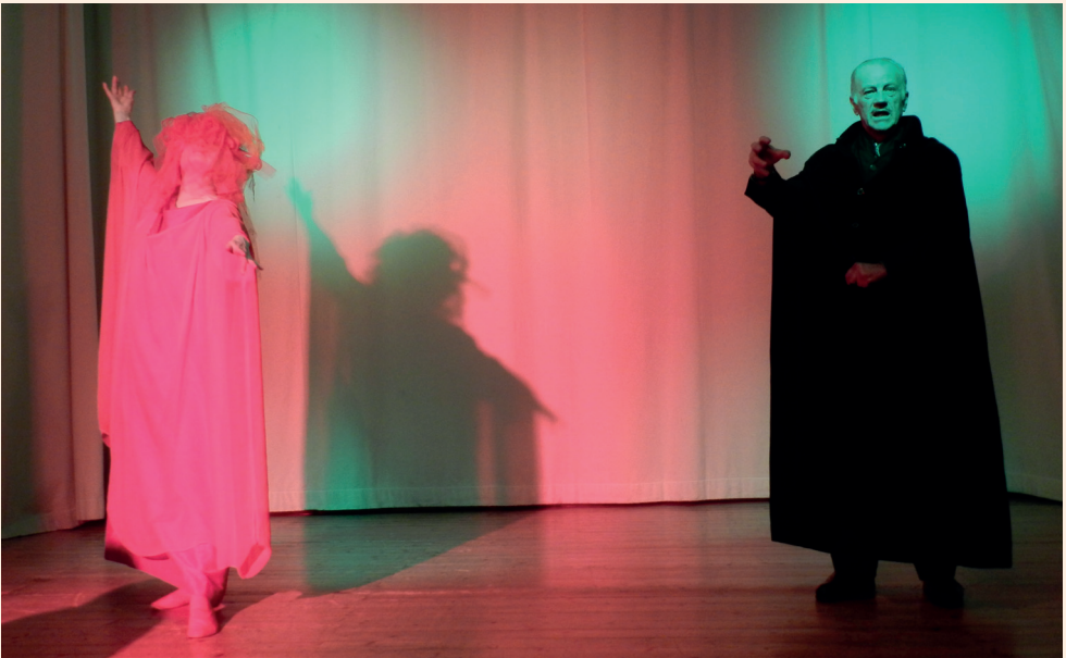
Luzifer und Ahriman in der Seelenwelt (4. Bild)

Johannes ist wieder tief in Meditation versunken, die Szene zeigt, was er dabei in der Seelenwelt erlebt. Zuerst erscheinen ihm Luzifer und Ahriman, wie Benedictus es angekündigt hat. Der eine lebt im Innern als Versucher, der andere trübt den Blick nach außen. Dann taucht aus den Erdentiefen der Geist der Elemente herauf, begleitet von Capesius und Strader. Der Geist der Elemente, der, wie er sagt, ihnen ihr Selbst gegeben hat, fordert nun seinen Lohn dafür. Doch beide können ihn nicht geben. Was sie bisher aus ihren Erkenntniskräften so stolz und hochmütig schöpfen können, erregt nur Blitz und Donner in der Seelenwelt. So verlässt sie der Geist der Elemente und will seinen Lohn von der Frau fordern, die den beiden Gelehrten ihre seelische Kraft erfrischt - von Felica Balde. Doch bleiben Strader und Capesius nicht