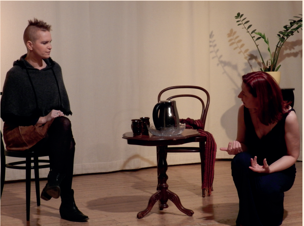
Sophia und Estella (Vorspiel)

Das Vorspiel führt nun weiter zu einem Streitgespräch zwischen Estella und Sophia. Sophia ist, wie schon der Name andeutet, die Verfechterin der Geisteswissenschaft, der Anthroposophie,