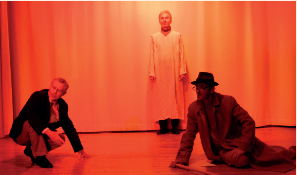
Strader, Capesius und der Geist der Elemente in der Seelenwelt (4. Bild)

«Ich habe mir errungen Die Kraft, zum Licht zu kommen.»